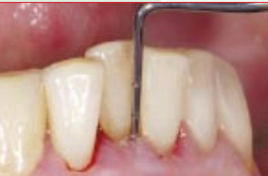
Abbildung 6: Code 4

Code 0: Das schwarze Band der Sonde bleibt an der tiefsten Stelle des Zahnfleischrandes aller Zähne eines Abschnittes vollständig sichtbar. Zahnstein oder defekte Füllungsänder sind nicht festzustellen. Das Zahnfleisch ist gesund, nach (vorsichtigem) Sondieren tritt keine Blutung auf.