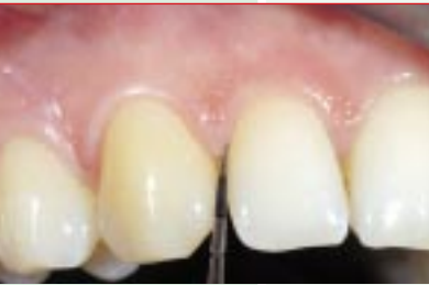
Abbildung 5: Code 0

Code 0 bedeutet, dass das Zahnfleisch gesund ist. Code 1 und 2 weisen auf eine Zahnfleischentzündung (Gingivitis) hin. Code 3 und 4 zeigen, dass bereits flache (3) oder tiefe (4) Zahnfleischtaschen (Parodontitis) vorliegen.